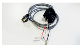
Cordon visualisation pilotage compresseur