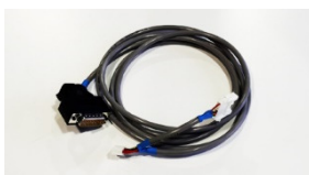
Cordon mesure ventilateur