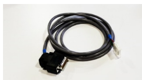
Cordon moteur ventilateur